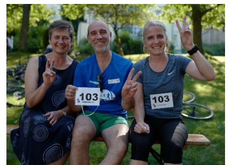
Bürger für Bürger beim diesjährigen Schlangen-Triathlon

→ Weiter auf Seite 3 mit einem ersten Vorschlag zum Schlangensteig